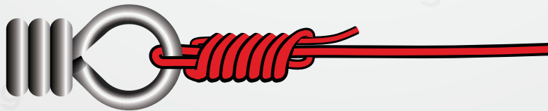
Schritt 4 Schritt 4